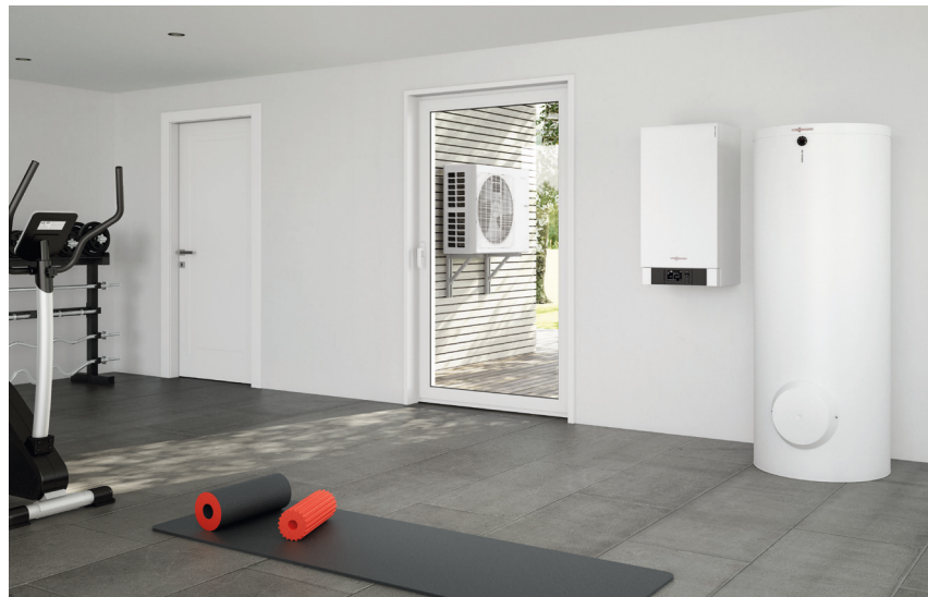
Pompă de căldură split aer/apă Vitocal 100-S, Boiler Vitocell ACM (dreapta) și unitate exterioră

Pompele de căldură split Vitocal 100-S și Vitocal 111-S sunt generatoare de căldură la preț atractiv, la calitatea și eficiența specifice Viessmann.